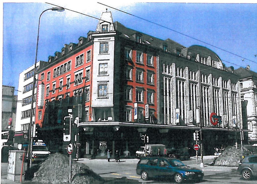
D'abord conçu comme un hôtel puis transformé en grand magasin, l'immeuble Au Printemps est un important témoignage de l'âge d'or de La Chaux-de-Fonds.

Rien n'y manquait! A la Belle Epoque, La Chaux-de-Fonds, en plein essor économique, prenait l'air de Paris. Situé sur la voie nord de la double avenue Léopold-Robert, l'immeuble Au Printemps participait à cette largeur de vue. Récemment revalorisé, il a évolué selon les besoins de son temps. D'abord conçu comme un hôtel, il a été fortement transformé par la suite en 1911 pour devenir un grand magasin avec une allure résolument moderne dans sa partie principale sud-est, tout en demeurant plus classique dans sa partie ouest. Dernièrement, Jelmoli puis Epa Unip ont successivement occupé le bâtiment pour quelques années. Dans la situation actuelle, la préférence a été donnée à une galerie marchande de 2140 m 2 occupée par cinq boutiques, un bar et un salon de coiffure au rez-de-chaussée. Le premier étage accueille un magasin d'ameublement contemporain. Les quatre étages supérieurs ont été transformés en 44 appartements et deux grands bureaux.